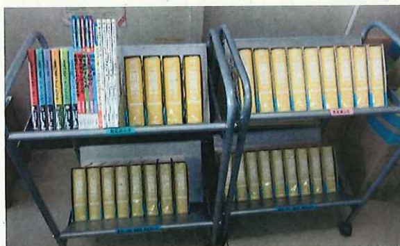
寄贈していただいた本や辞書

7月に入り、トヨタカローラ佐賀店様より本を寄贈していただきました。今年で10回目です。今年は、30冊の辞書と児童書など17冊、計47冊です。夏休みに、たくさんの人に読んでほしいと思います。